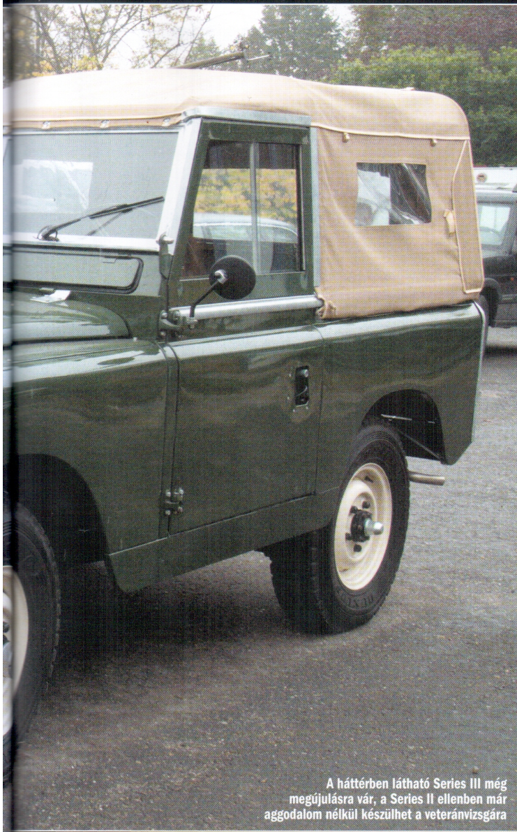
A háttérben látható Series III még megújulásra vár, a Series II ellenben már aggodalom nélkül készülhet a veteránvizsgára