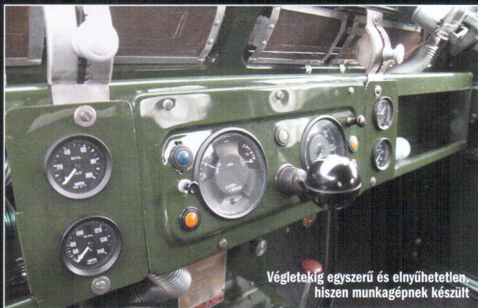
Végletekig egyszerű és elnyúlhatetlen, hiszen munkagépnek készült